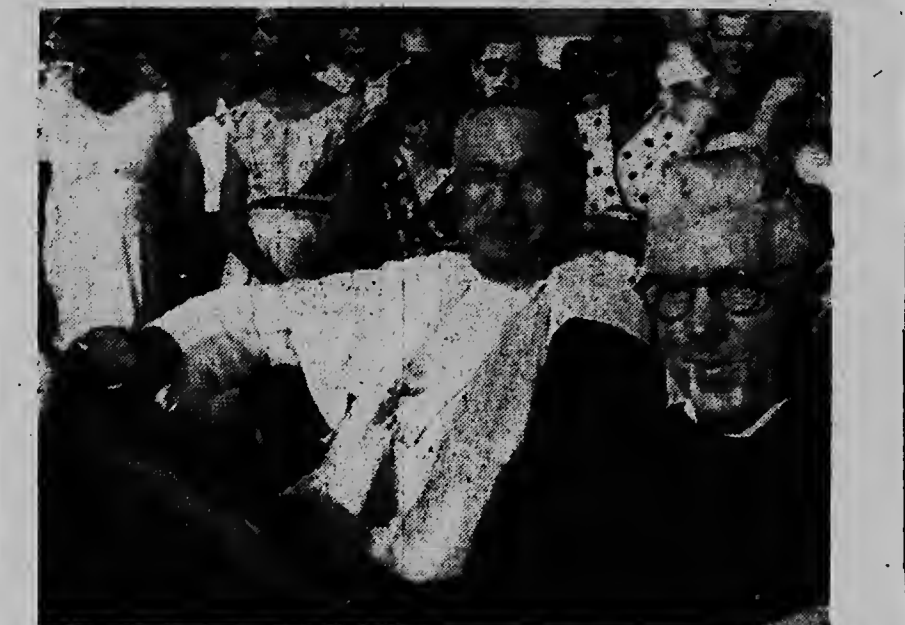
Despues di yegada di Obispo Diasabra atardi na vliegveld: hunto cu pastoor Burgemeester ela corre den un auto cap baha bal stad.